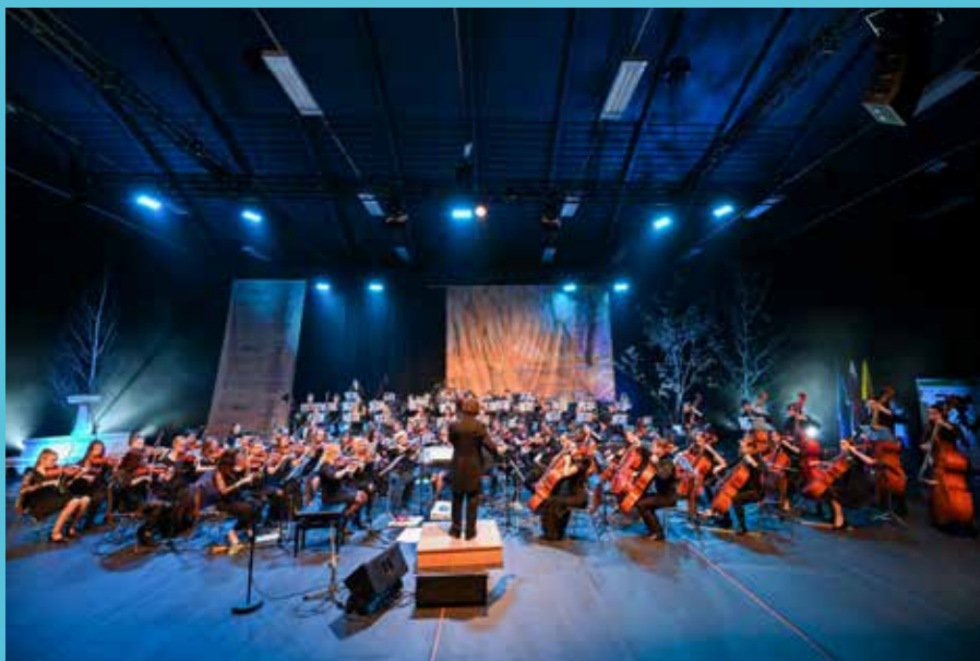
Izvedba koncerta ob slovenskem kulturnem prazniku, 7.2.2020