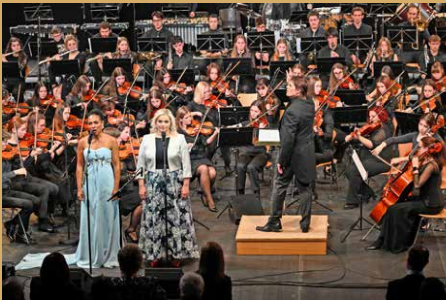
Izvedba koncerta ob slovenskem kulturnem prazniku, 7.2.2025