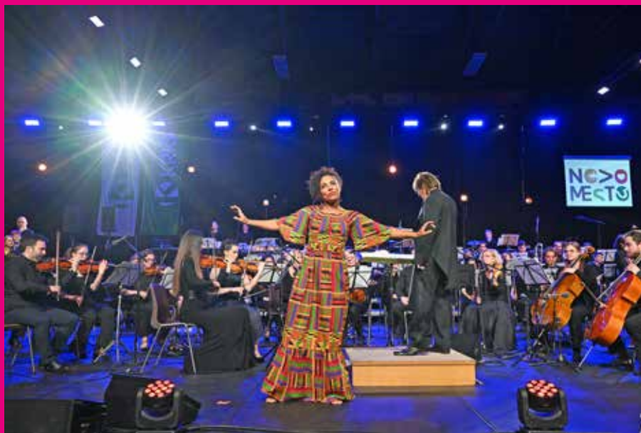
Izvedba koncerta ob slovenskem kulturnem prazniku, 7.2.2023