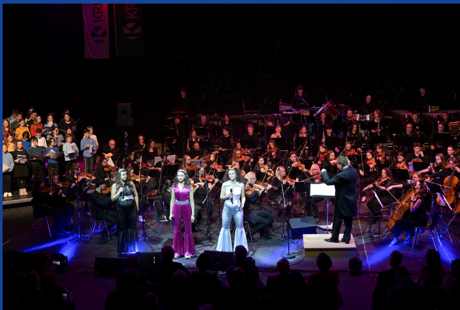
Izvedba koncerta ob slovenskem kulturnem prazniku, 7.2.2024